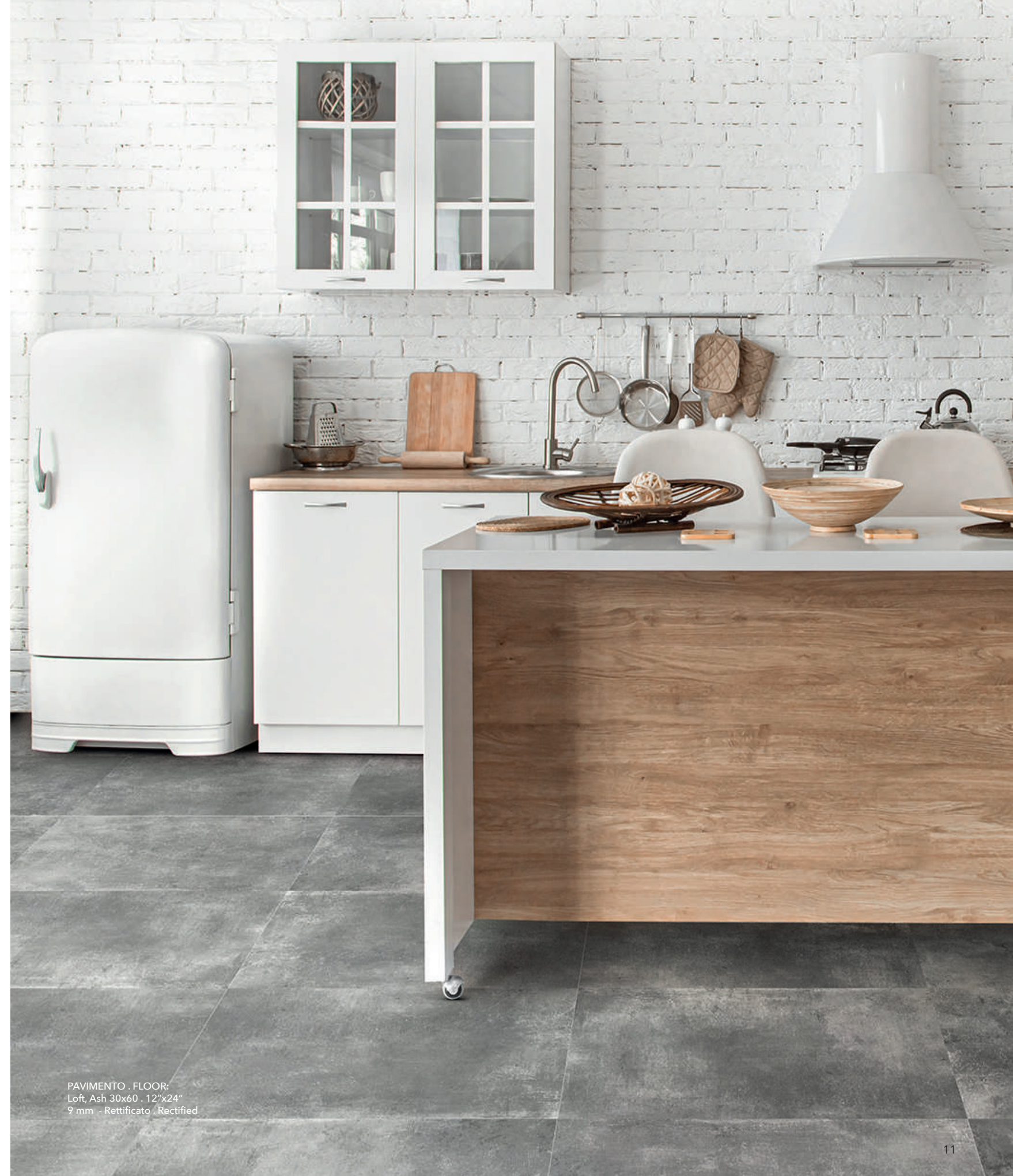
PAVIMENTO . FLOOR: Loft, Ash 30x60 . 12"x24" 9 mm - Rettificato / Rectified